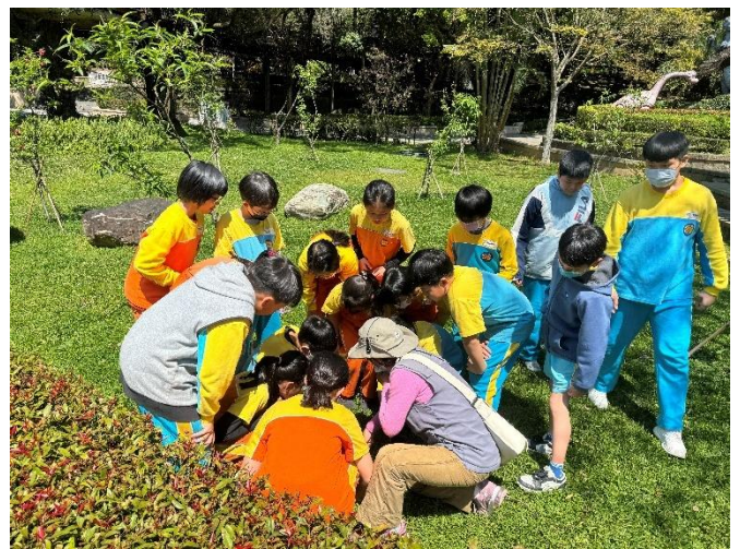
圖 10.說明：虎頭山導覽志工正在進行”葉子的秘密”解說，順便為樹葉拓染活動取材。