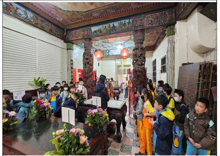
圖 8.說明：北門土地公廟-保德祠參訪。