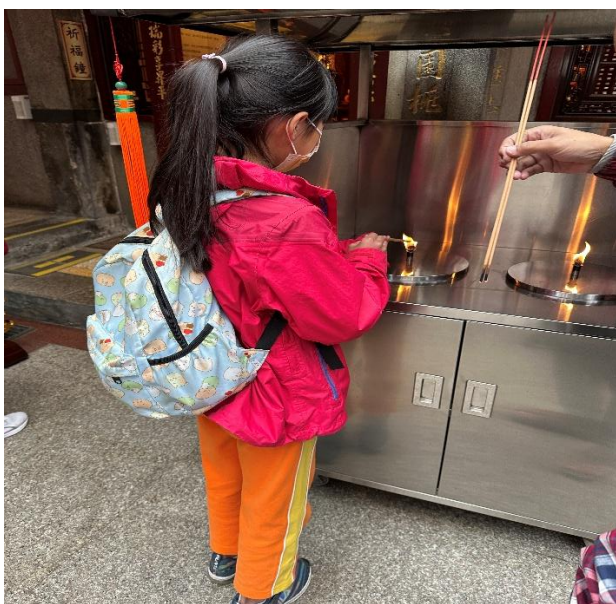
圖 5.說明：學生入境隨俗，點香膜拜，欲向神明祈求。