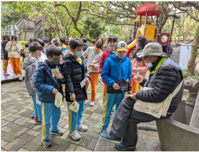
圖 15.說明：為我們導覽的老師是高齡田徑短跑紀錄保持者-金牌爺爺，學生爭相拿著他的明信片簽名，是活動中意外的收穫。