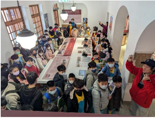
圖 13.說明：3/18 因遇到大廟有祭典活動，當天解說改在大廟派出所。