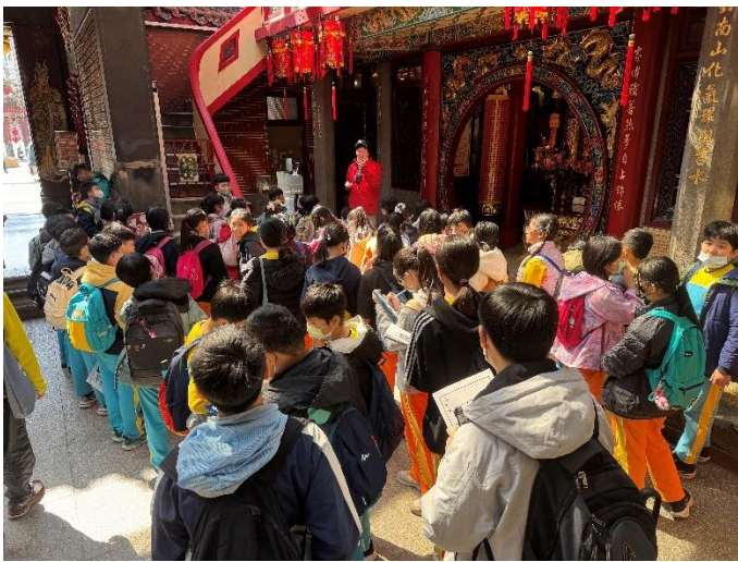
圖 3.說明：活動進行中，在景福宮內學生聆聽導覽老師解說，並認真作筆記。