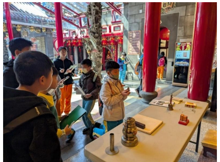
圖 6.說明：除了燒香拜拜，透過擲茭杯向神明確認心中所求之事。這次戶外教育更是學生參與、體驗民俗文化難得的機會。