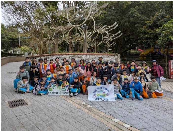
圖 9.說明：虎頭山生態公園與導覽老師們大合照。