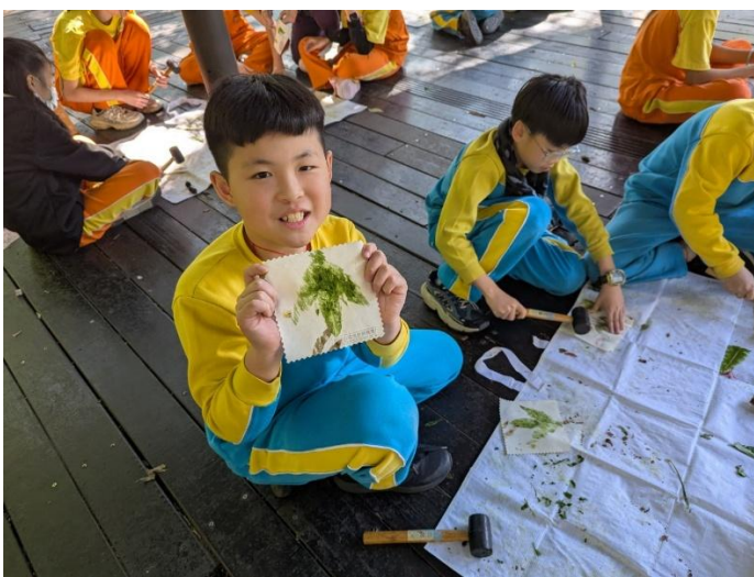
圖 11.說明：在虎頭山進行植物槌染活動，孩子們認真地將葉子排出各種造型，進行創作活動。