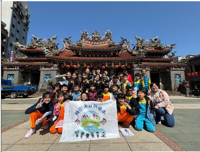
圖 7.說明：景福宮前合照。