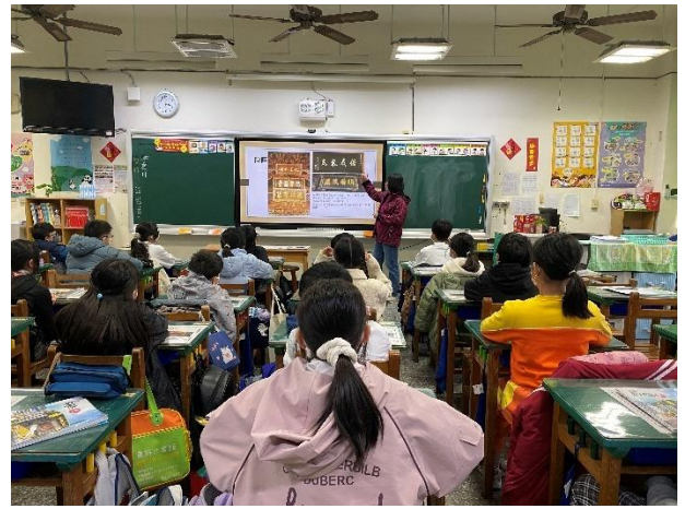
圖 2.說明：老師製作教學簡報，於活動前課間說明，讓學生對活動內容有先備概念。