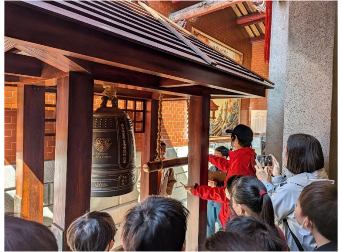
圖 14.說明：體驗敲祈福鐘，期望能得到神明的庇佑，平安健康。