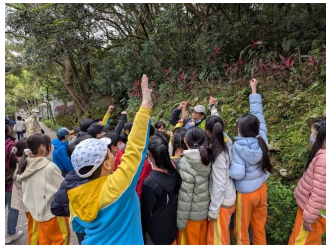
圖 16.說明：虎頭山公園導覽學生與導覽老師互動極佳。