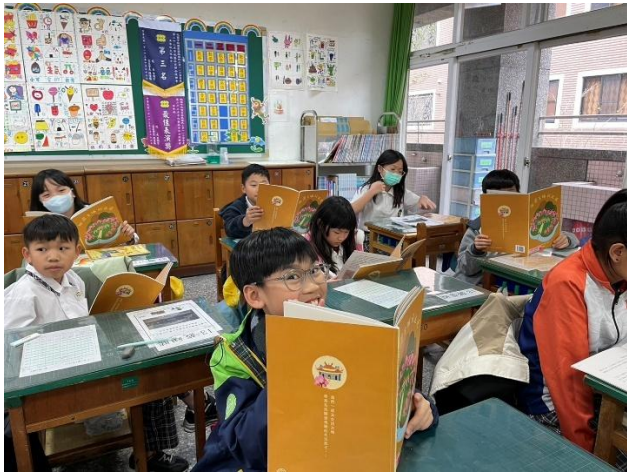
圖 1.說明：利用在地化課程文本，進行課前說明。