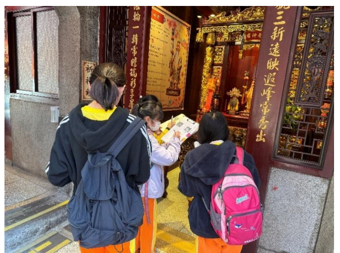
圖 4.說明：導覽完畢，學生在廟內進行自由探索，認真尋找學習單內問題答案。