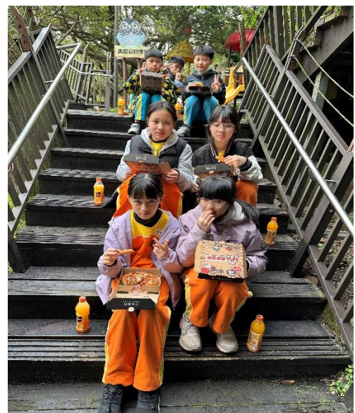
圖 12.說明：享用美味午餐